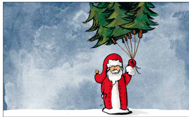
Nr. 2041 Weihnachtsmann als Tannenluftballonbaumverkäufer