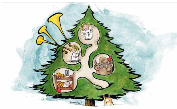
Nr. 2042 Weihnachts-Wichtel Spa