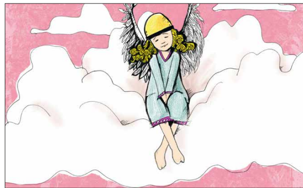
Nr. 2039 Weihnachtsengel