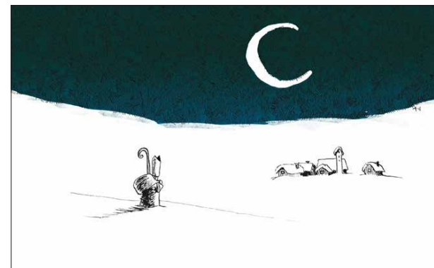
Nr. 2043 Nikolo