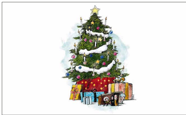
Nr. 2040 Christbaum