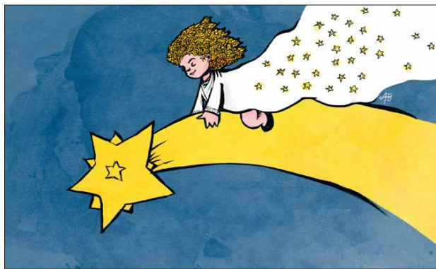
Nr. 2038 Christkind mit Weihnachtsstern